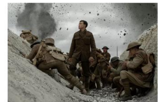
1917, de beste film volgens de lezers.

Door Beekman en Bart Koetsenruiter 6 januari 2021, 15:19